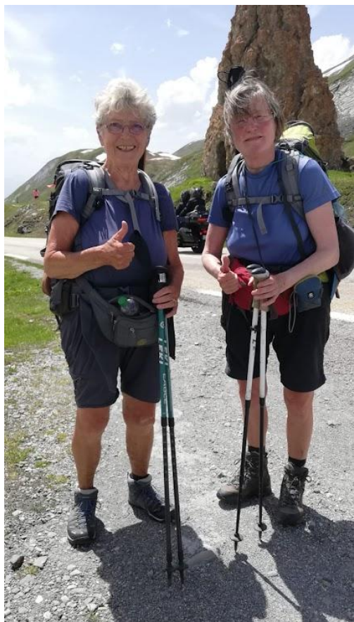
Arrivée au col du petit St Bernard

Depuis on a tous des nouvelles de leurs nombreux périples