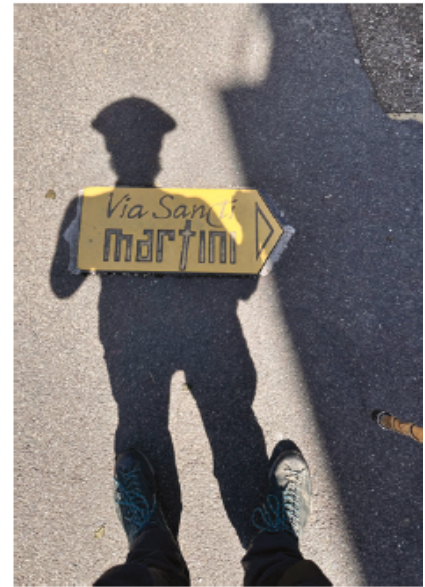
DANS LES PAS DE SAINT-MARTIN |